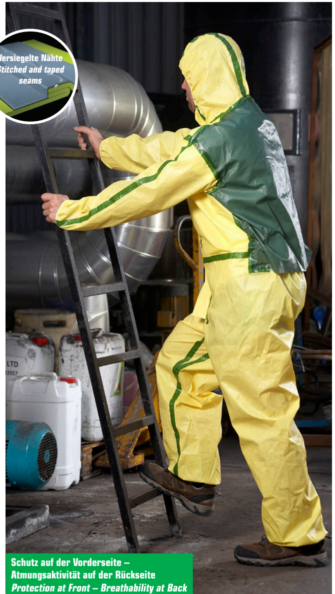
Schutz auf der Vorderseite – Atmungsaktivität auf der Rückseite Protection at Front – Breathability at Back