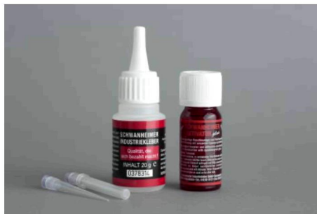
Schmuckkleber-Set Artikel-Nr.: 19-33320

Tipp: Schmuckteile wie z.B. Rohsteine auf einem beliebigen Gegenstand zum Bearbeiten (Schleifen, Hochglanzpolieren etc.) fixieren/ankleben und anschließend wieder mit dem Universal-Löser und Reiniger lösen.