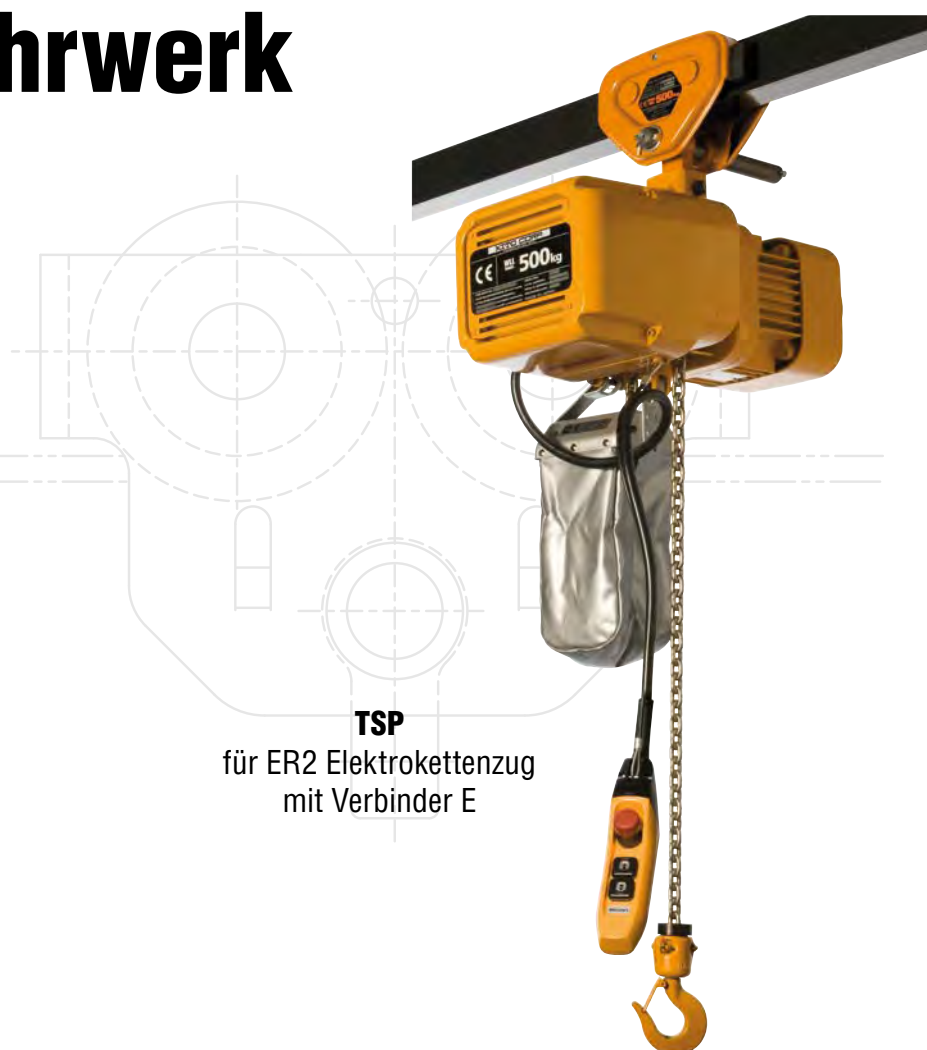
TSP für ER2 Elektrokettenzug mit Verbinder E