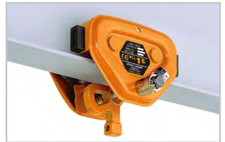
TSP Rollfahrwerk 125 kg bis 2.000 kg