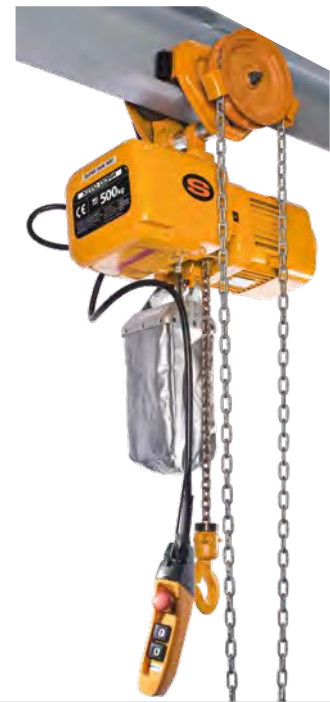
TSG für ER2 Elektrokettenzug mit Verbinder E