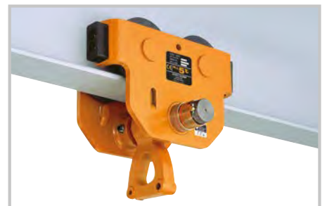
TSP Rollfahrwerk 3.000 kg - 5.000 kg