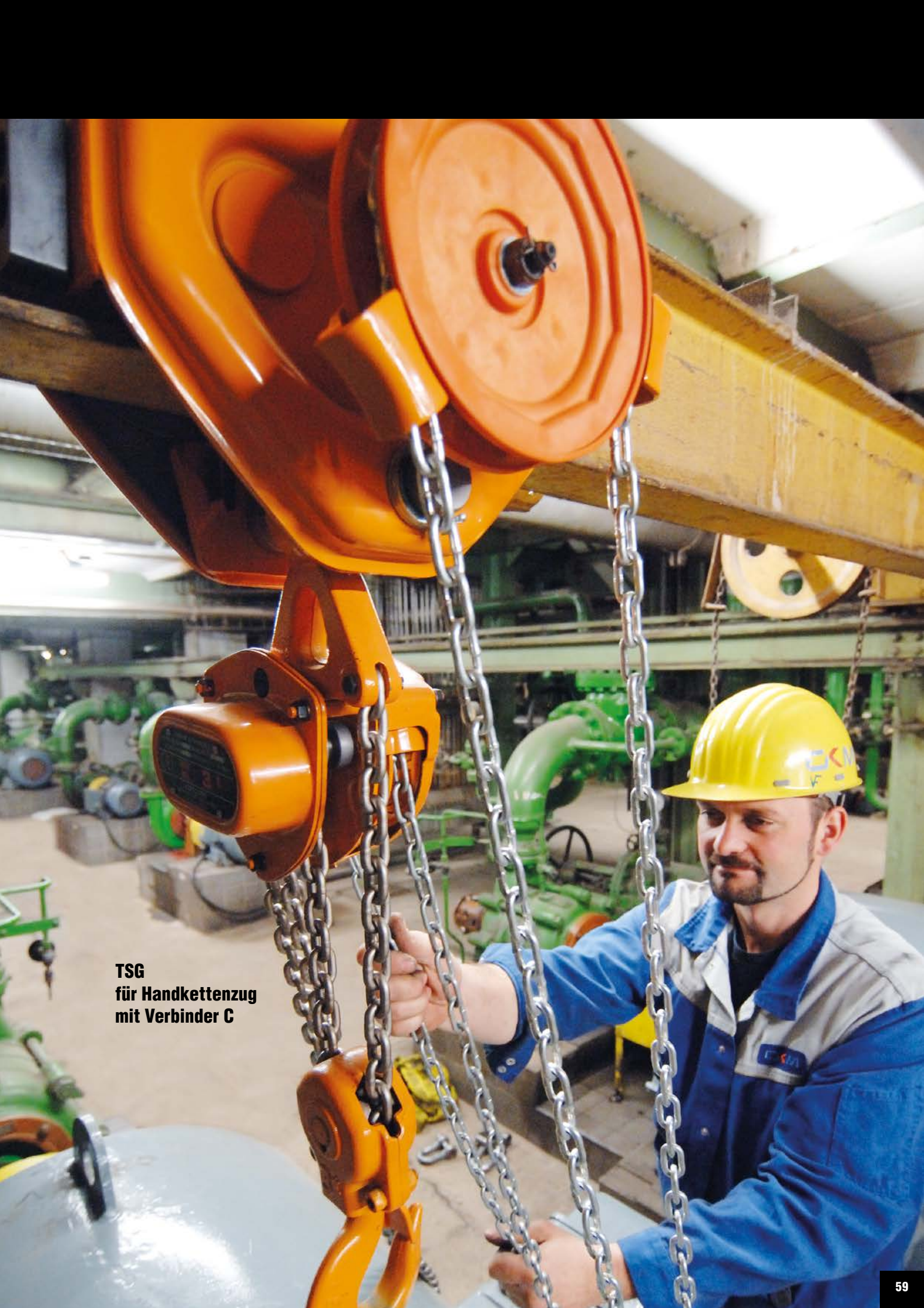
TSG für Handkettenzug mit Verbinder C