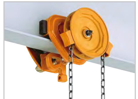
TSG Haspelfahrwerk 125 kg bis 3.000 kg