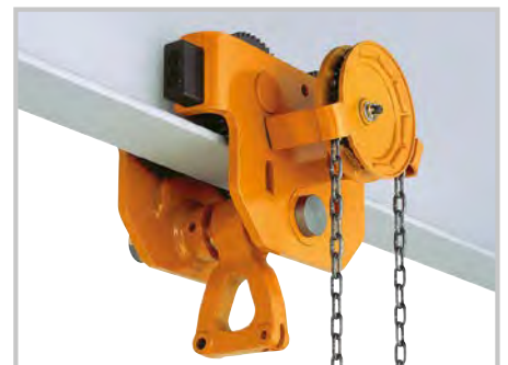
TSG Haspelfahrwerk 5.000 kg bis 30.000 kg