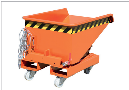
EXPO-E mit Rollen

Spänebehälter mit niedriger Bauhöhe und Abrollmechanismus