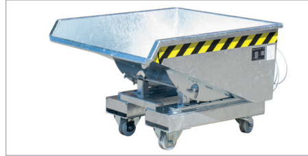
EXPO 225 mit Rollen