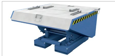
EXPO 225 mit Deckel