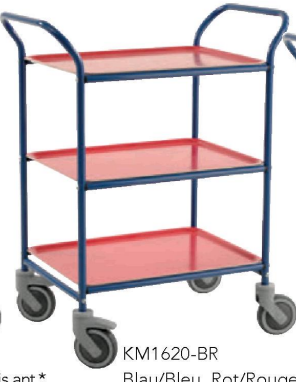
KM1620-BR Blau/Bleu, Rot/Rouge