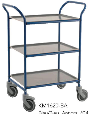
KM1620-BA Blau/Bleu, Ant.grau/Gris ant.*