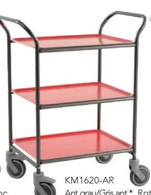
KM1620-AR Ant.grau/Gris ant.,* Rot/Rouge