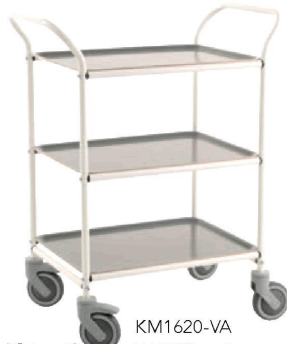
KM1620-VA Weiß/Blanc, Ant.grau/Gris ant.*