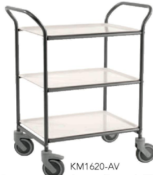
KM1620-AV Ant.grau/Gris ant.,* Weiß/Blanc