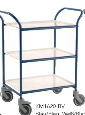
KM1620-BV Blau/Bleu, Weiß/Blanc