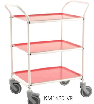
KM1620-VR Weiß/Blanc, Rot/Rouge