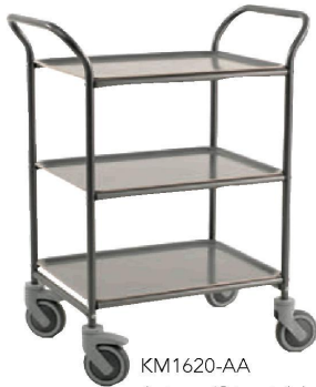
KM1620-AA Ant.grau/Gris ant.,* Ant.grau/ Gris ant.*