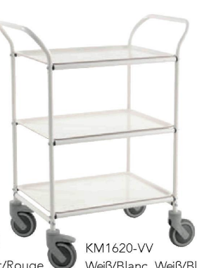
KM1620-VV Weiß/Blanc, Weiß/Blanc