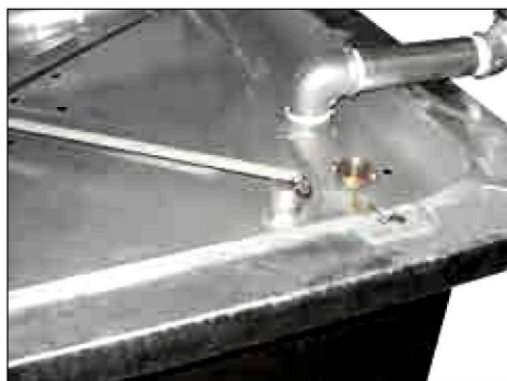
Peilstab zur Füllstandskontrolle