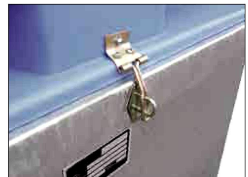
Kunststoffdeckel arretier- und abschließbar (Zubehör)