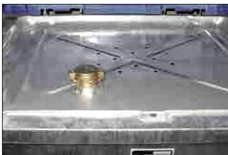
Einlaufwanne und 2" Tankwagenkupplung