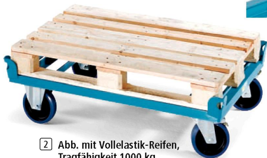
2 Abb. mit Vollelastik-Reifen, Tragfähigkeit 1000 kg