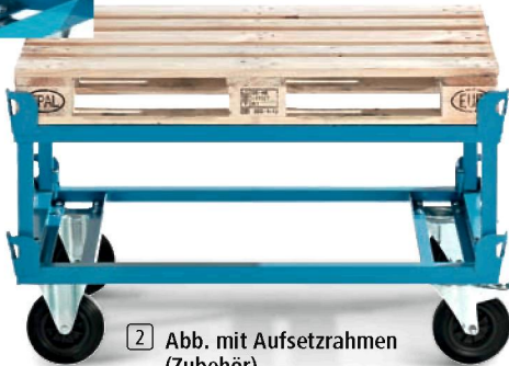
2 Abb. mit Aufsetzrahmen (Zubehör)