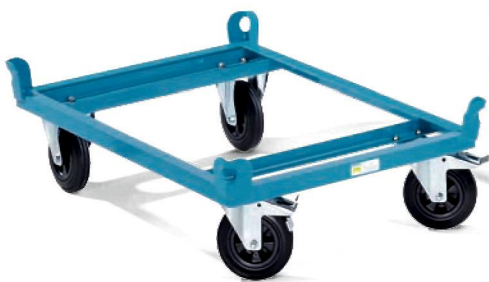
1 Abb. mit Vollgummi-Reifen, Tragfähigkeit 500 kg