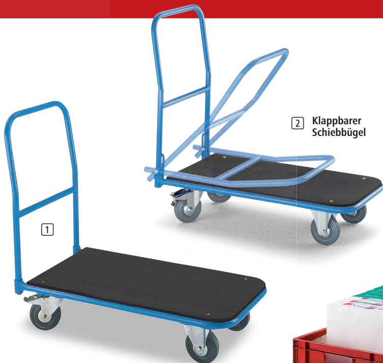
2 Klappbarer Schiebbügel