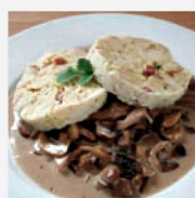
Herstellung von Serviettenknödeln