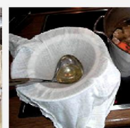
Klärung von Suppen und Soßen