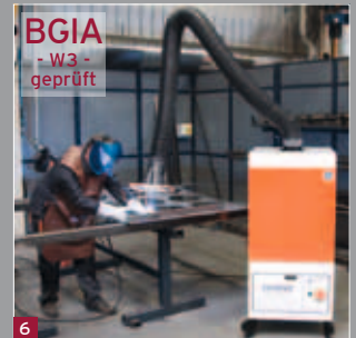
Schweißrauchfilter / Filter Master XL: Höchste Prüfstufe W3 des Berufsgenossenschaftlichen Instituts für Arbeitssicherheit (BGIA) erfüllt