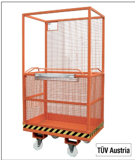
Typ MB-A mit Rollen