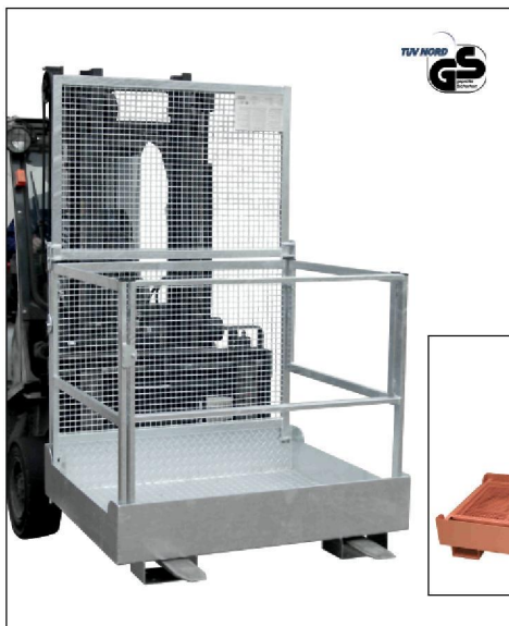
Typ MB-F verzinkt