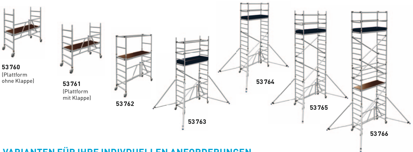
53760 (Plattform ohne Klappe)

Nur noch Plattform einhängen; beide Abhebesicherungen der Plattform um Sprosse legen und fertig!