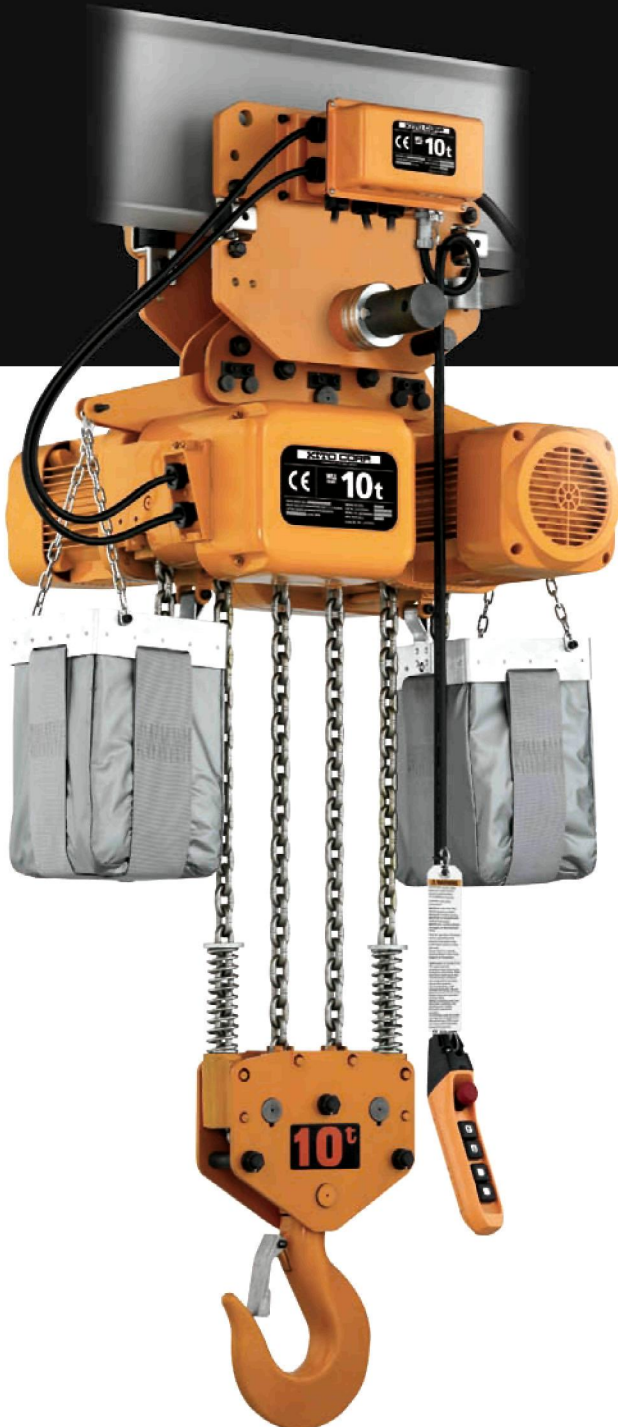
ER2M100 mit Motorfahrwerk MR2 1 Hub- und 1 Fahrgeschwindigkeit