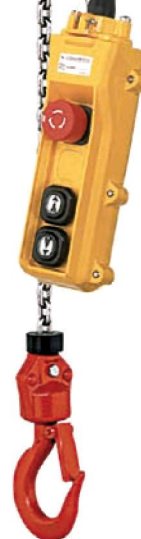
ED24 Hakenaufhängung 2 Hubgeschwindigkeiten

.... Sicherheitsrelevante Besonderheiten sind die mechanische Hochleistungsbremse mit Rutschkupplung sowie der obere Hubendschalter.