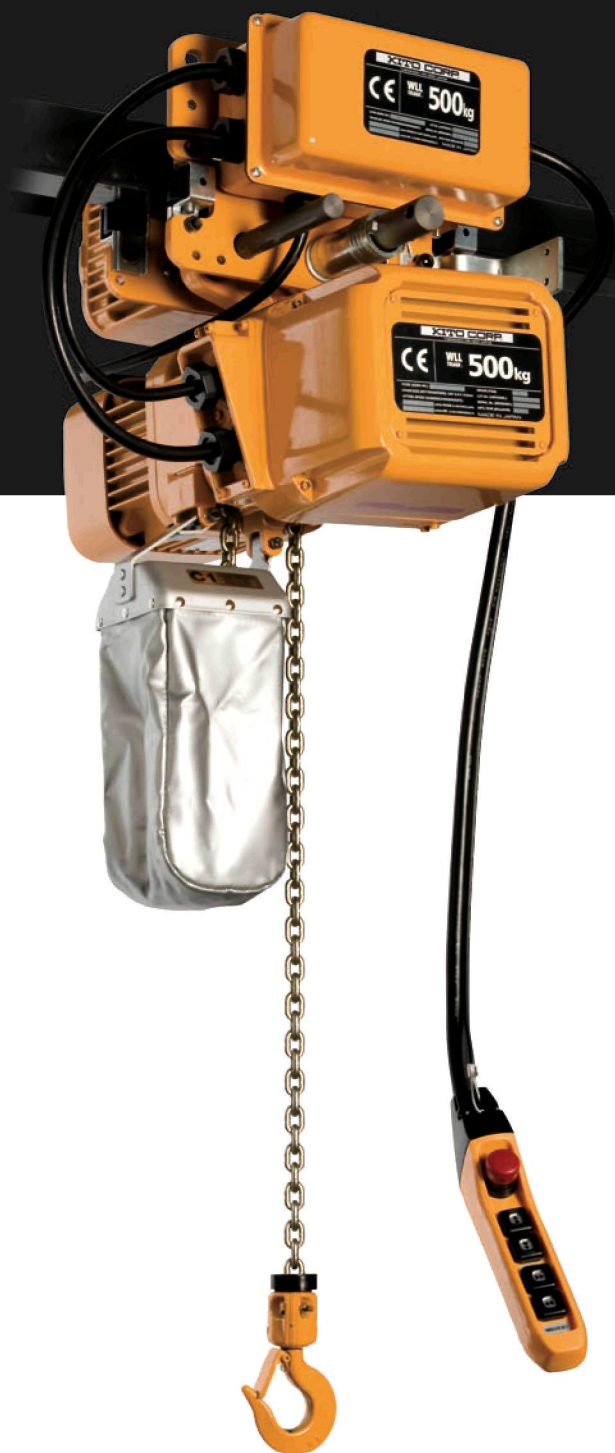
ER2M005 mit Motorfahrwerk MR2 2 Hub- und 2 Fahrgeschwindigkeiten