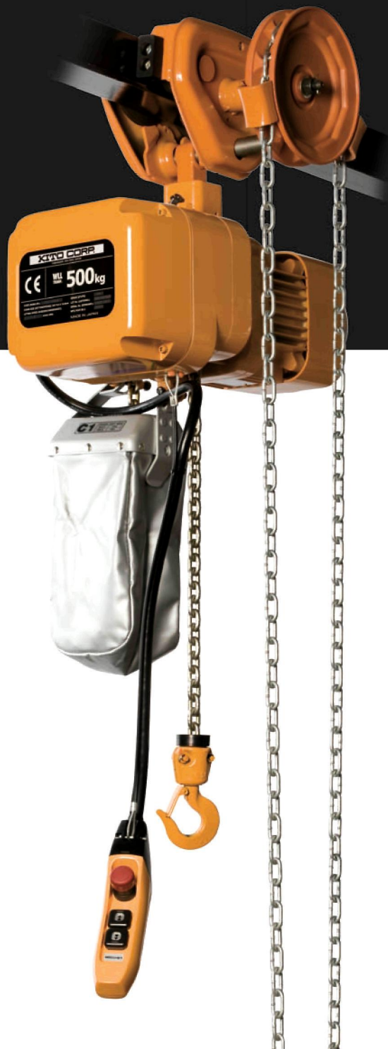
ER2SG005 mit Haspelfahrwerk TSG 1 Hubgeschwindigkeit