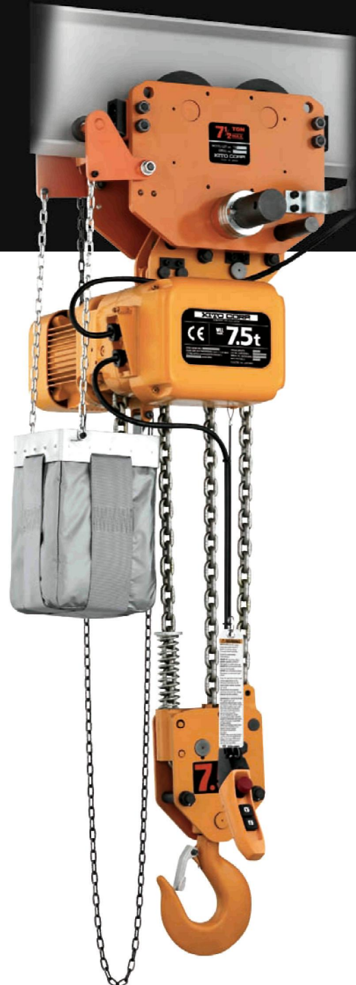
ER2SG075 mit Haspelfahrwerk TSG 1 Hubgeschwindigkeit