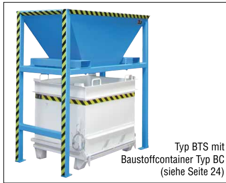
Typ BTS mit Baustoffcontainer Typ BC (siehe Seite 24)