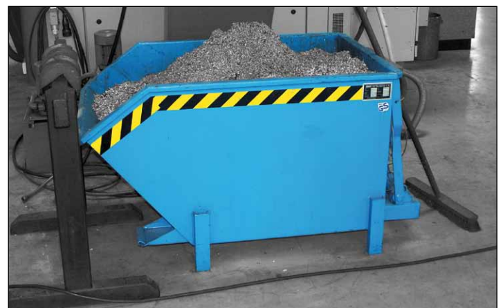
Typ SGU mit Stützfüßen (Zubehör)