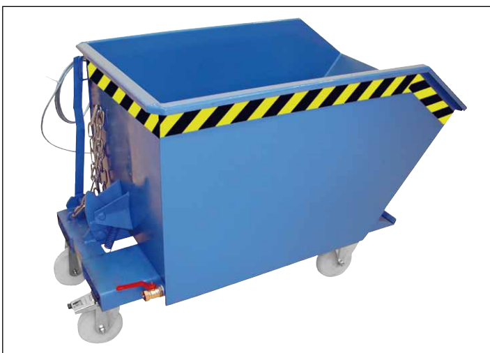
Typ SGU mit Rollen (Zubehör)