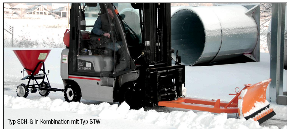
Typ SCH-G in Kombination mit Typ STW