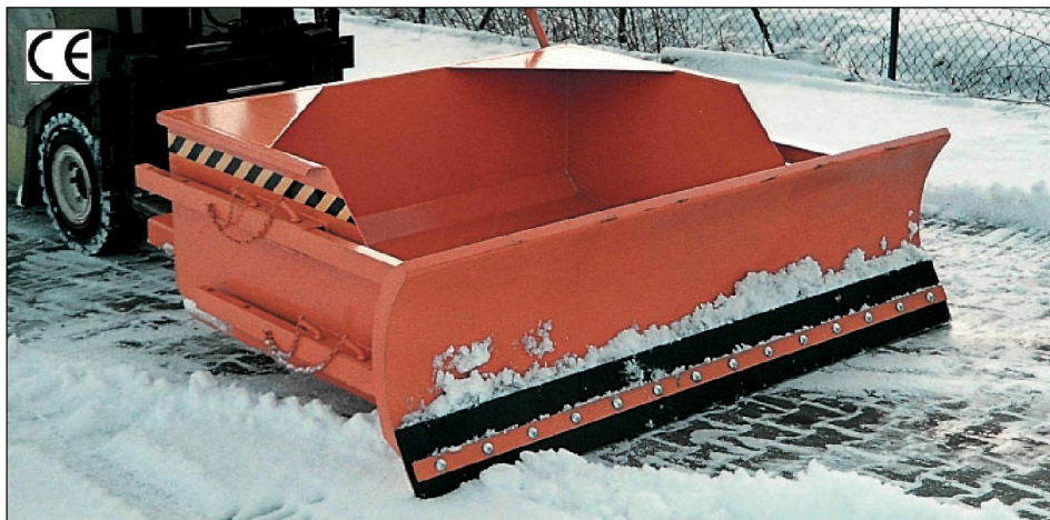
Typ SRS-G mit Gummischürfleiste