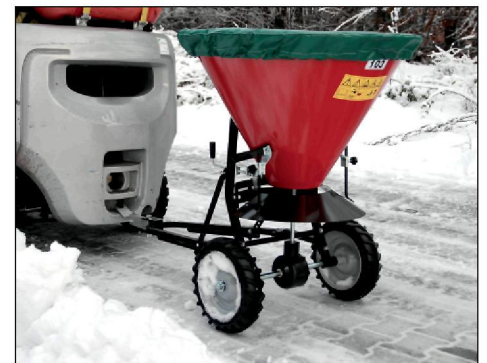
Typ STW mit Abdeckplane